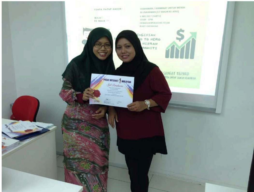
Caption : Kelas Keusahawanan